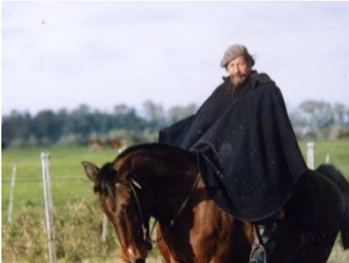
Fig. 1. Testimonio de su vida en el campo, montando en su último caballo, “Serenio”, en la Estancia San Jorge, Conchillas, Departamento de Colonia (Julio de 1983).

(“Francamente te lo digo, estoy totalmente amargado y pletórico del más negro pesimismo. Por que?? Resulta que es muy difícil poder hacer trabajos de sistemática con poca bibliografía, entreverado con los novillos, mezclado con los raigrases, etc.” Carta dirigida al autor, 28.05.1971. Fig. 1), pero siempre aprovechando todo momento libre para entregarse a sus estudios predilectos (“ando a las patadas para poder hacer con gran sacrificio los trabajos que en realidad me interesan, o sea los de cetáceos” (ídem). “No obstante en ratos robados y a horarios peregrinos he podido pergeñar un trabajuelo para la Reunión del Grupo de Mamiferólogos Marinólogos de Junio en Bs. As.” (ídem, 02.04.1984). A pesar de estas dificultades y sacrificios su producción bibliográfica está representada por casi 90 títulos (ver Bibliografía).