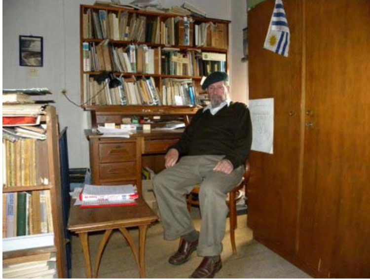
Fig. 10. En el estudio de su casa de Punta del Diablo, Rocha, Uruguay.

Devemos nos espelhar na história destes dois grandes pesquisadores e dar continuidade às nossas pesquisas. A Ciência sempre é feita utilizando o trabalho daqueles que nos precederam, dando crédito ao trabalho realizado e construindo ainda mais. Desde a 1ª RT, em 1984 em Buenos Aires, muito já aprendemos sobre os mamíferos aquáticos, mas seguramente ainda há muito por aprendermos!”