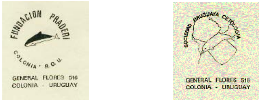
Fig. 5. Logos de la Fundación Praderi y de la Sociedad Uruguaya de Cetología .

Asimismo, participó en numerosos congresos y reuniones científicas, tanto nacionales como internacionales. Para respaldar sus investigaciones creó la Fundación Praderi y la Sociedad Uruguaya de Cetología (Fig. 5), ambas de carácter unipersonal, pero que le permitían darle un marco institucional a los pedidos de apoyo financiero para llevar adelante sus proyectos.