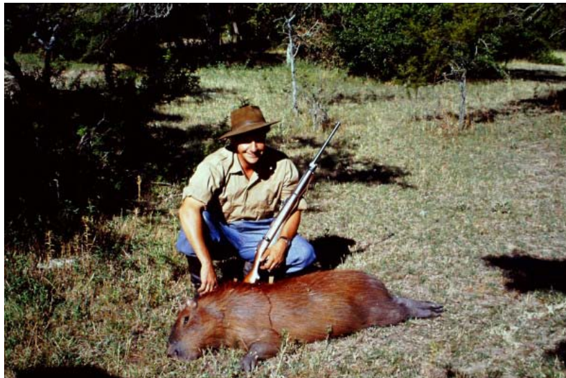
Fig. 4. Junto a un hermoso ejemplar de carpincho ( Hydrochoerus hydrochaeris) cazado en el Arroyo Limetas (Estancia San Jorge, Colonia, Uruguay) para enriquecer la colección del Museo [MNHN 2558].

Asesor del FAO Committee of Experts on Marine Resources Research, Investigador Asociado de la Division of Mammals de la Smithsonian Institution, Miembro Correspondiente de la SSC/IWC, Consultor Honorario del Panel de Especialistas en Mamíferos Marinos de la WWF.